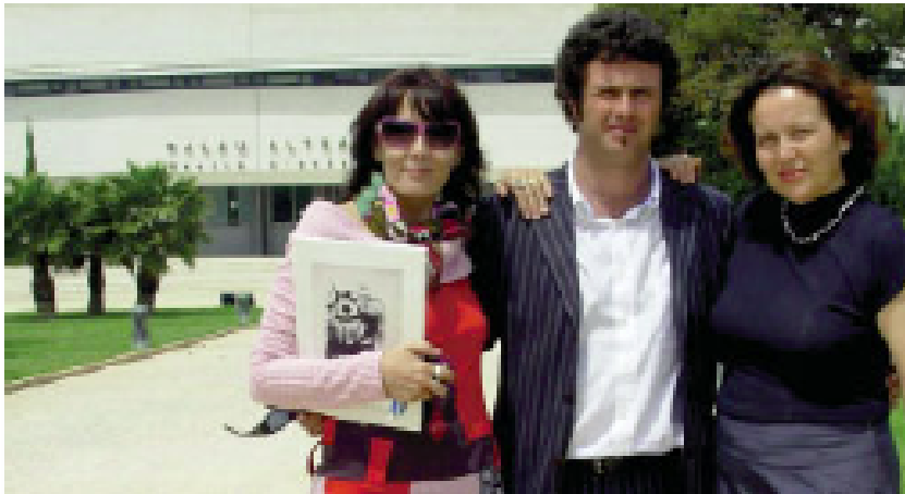
Altea fue sede de un Intercambio de Educación Superior