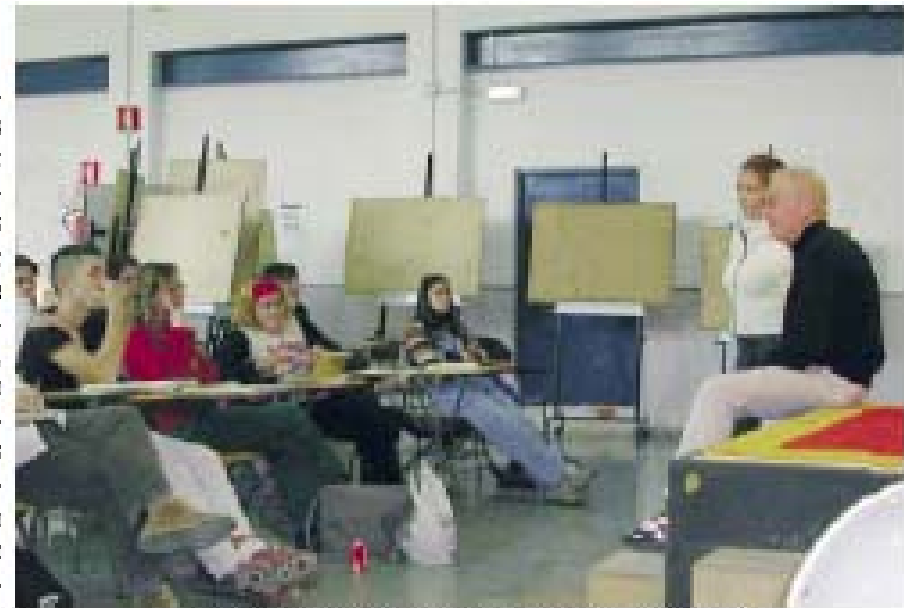
Las preguntas venían sobre la relación entre editor y director de cine

la interacción con los alumnos y muy frecuente en las universidades americanas. Las preguntas y las respuestas giraron en torno a las relaciones creativas y profesionales entre el editor y el director de cine, la formación en fotografía y cine en América y Europa, las distintas maneras de convertirse en profesional, el desarrollo de las técnicas en la edición de cine desde comienzo de la historia cine hasta las últimas técnicas digitales. Los estudiantes hicieron muchas preguntas sobre estos temas y entendieron cómo el dibujo está en la base de nuestra cultura visual, una cultura que el editor dice tiene sus raíces en la representación realista del Renacimiento y alcanza su máximo desarrollo con las nuevas tecnologías de la imagen.